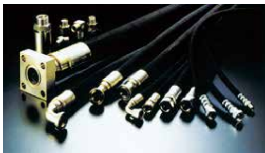
横浜ゴム製ホースアッシー