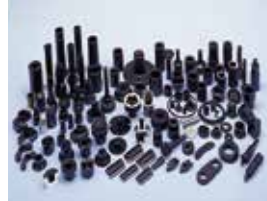
精密冷間鍛造加工