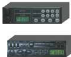
ラジカセ・ラジオ