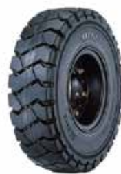
ノーパンクタイヤ